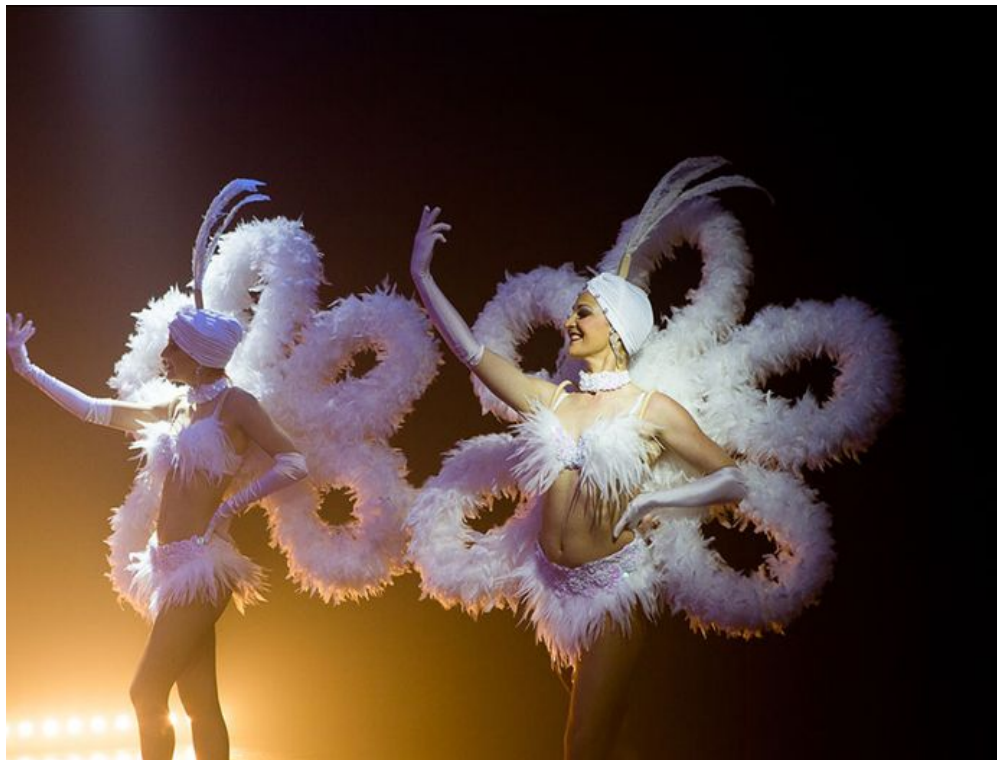
Un cabaret de prestige au Domaine de Verchant ! - IDYLLIUM LIVE