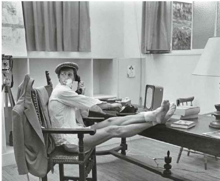
Ci-contre: Jean-Paul Belmondo immortalisé par Alain Adler sur le tournage d' À bout de souffle en 1959. Ci-dessous: Apollon (2005), de Pierre et Gilles.