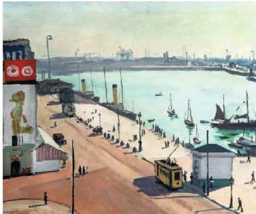
Ci-contre : Le Quai du Havre (1934), peinture d'Albert Marquet.